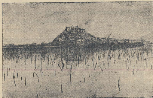
Žabljak, prestonica Crnojevića

nebeskim carstvom, na četvrtom za oslobođenjem od tuđinskog jarma, na petom za oslobođenjem od svakog jarma, na šestom itd. Ovako različite žudnje u narodnu poeziju nije unosio ni jedan cjelovit narod niti pak jedan izdvojen stalež, već pojedinci ili čitavi manje ili više diferencirani staleži: plemići, sveštenici, seljaci, ratnici itd. Zbog toga je narodna poezija kao cjelina dobila karakter dokumenta o jednom narodu, koji se u njemu ne pojavljuje kao posebna i izgrađena individualnost.